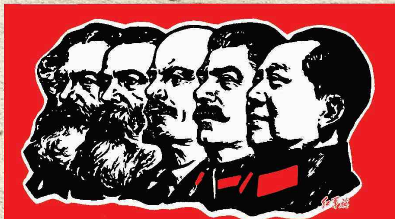
«Москва - Пекин» («Сталин и Мао») 莫斯科北京

数百万中国人将中国共产党成立和国家社会经济形成过程中所得到的帮助与斯大林的名字密切地联系在一起。所以，我们能够理解为什么普通的中国人和中国的领导人消极地接受赫鲁晓夫的《揭露斯大林的个人崇拜路线》。这导致了我们的两国关系处于漫长的“冰河时期”。在今天的中国，对苏联、斯大林和数以千计的中国的自由而牺牲的苏联士兵们不仅仅保留着形式上，而是全民族的尊敬。随着经济合作关系的深入发展，这段历史记忆成为我们两国战略合作伙伴关系的基础。