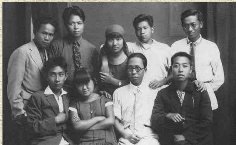
Поддержка Советским Союзом Коммунистической партии Китая выражалась не только в экономической и военной помощи, но и в подготовке китайских революционеров и военных кадров для китайской революции. На фото: группа китайских студентов Коммунистического Университета трудящихся Китая (ориентировочно 1928 год, Москва). 苏联所给予中国共产党的不仅仅是经济和军事上的帮助，还有对中国革命者和中国革命军事人员的培训。 图为共产主义劳动大学的中国学生班（约摄于1928年，莫斯科）。

Припев. Музыка: В.Мурадели. Слова: М.Вершинина